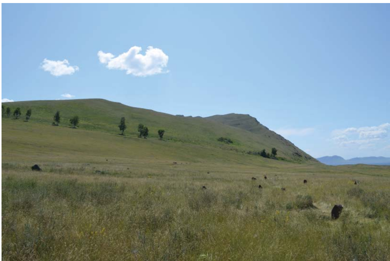
Рис. 1. Общий вид на курганное поле у подножия горы Тепсей. Fig. 1. General view of the barrow field at the foot of Mount Tepsei.

ными у их оснований. На плитах конструкций оград тагарских курганов нередко встречаются различные выбитые и высеченные изображения, которые привлекали внимание ученых, путешественников и обывателей еще с XVIII в. (Д.Г. Мессершмидт, Д.А. Клеменц, И.П. Кузнецов-Красноярский, А.В. Адрианов и др.). В последние годы интерес к данному виду источников постепенно возрастает (Семенов и др., 2003; Ковалева, 2013; и др.). К настоящему времени при полевом исследовании тагарских курганов отдельное внимание уделяется рисункам в их конструкциях (Данькин и др., 2020; Зоткина и др., 2021; Герман, Мухарева, Емельянцева, 2022; и др.). Кроме того, исследователи все чаще обращаются к анализу рисунков на могильниках, расположенных рядом с местонахождениями наскальных изображений (Миклашевич, Бове, 2015; Мухарева, 2021; Мухарева, Рогова, 2019; и др.).