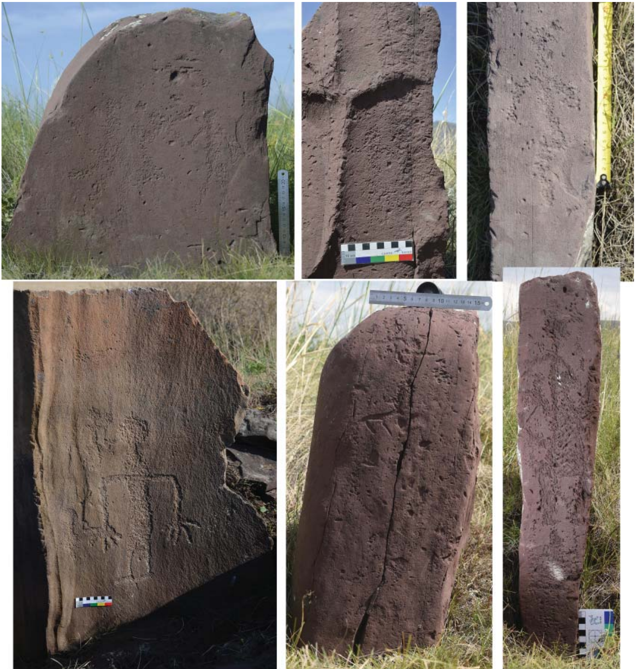
Рис. 5. Изображения антропоморфных персонажей на плитах оград тагарских курганов под горой Тепсей.