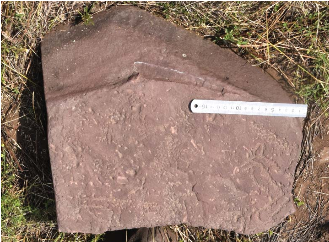
Рис. 2. Плита с остатками изображения животного в скифо-сибирском зверином стиле. Устье Широкого лога.