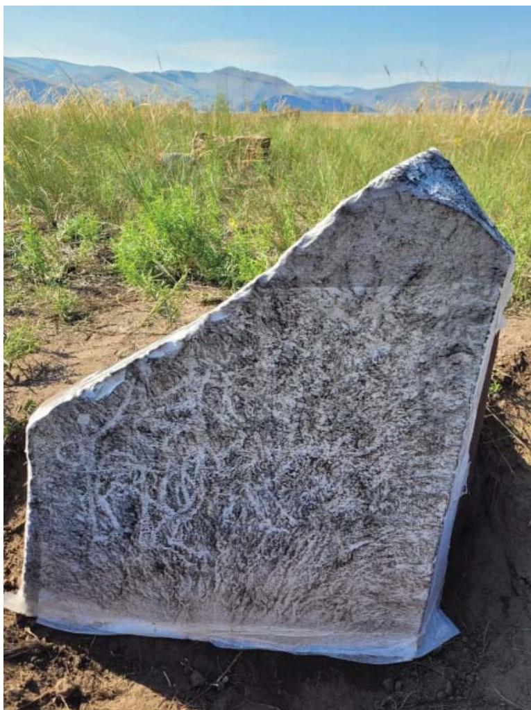
Рис. 4. Камень с изображениями «великанов». Тепсей V.