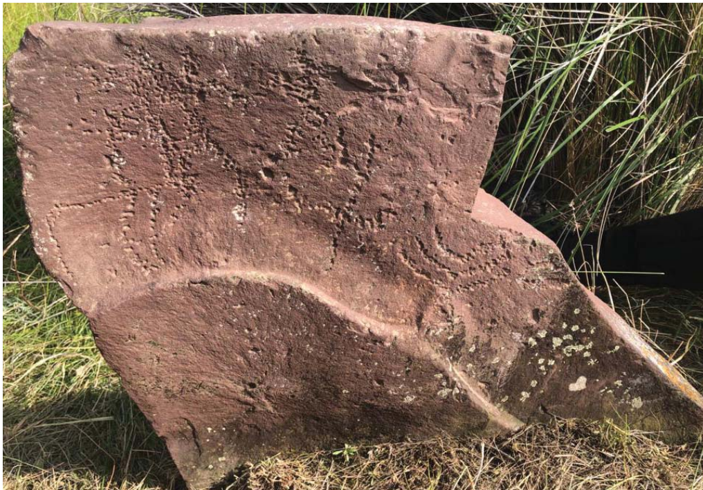
Рис. 7. Плита с «поздними» рисунками. Тепсей VII.