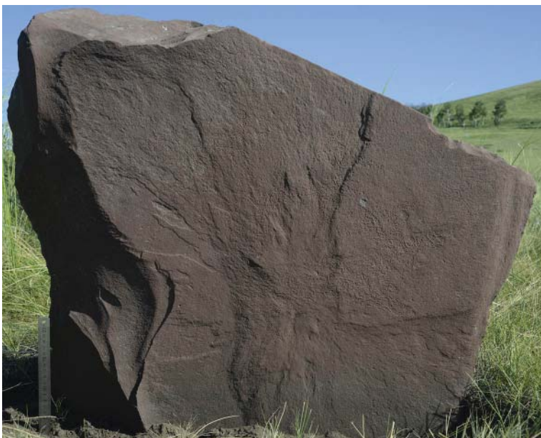
Рис. 6. Изображения лося таштыкского времени, Тепсей VIII.