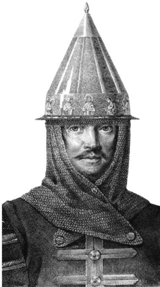
Рис. 9. Изображение шлема с Деисусом в «Историческом описании одежды и вооружения российских войск» (Восковатов, 1843. Рис. 47).