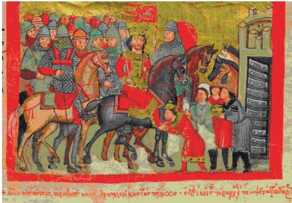
Рис. 5. Миниатюра из «Романа об Александре» (Л. 36 об.).