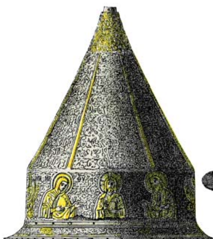
Рис. 2 Шлем с Деисусом и шлем из раскопок курганов Южной Руси в XIX в. (Прохоров, 1883. Табл. VIII. 1, IX.1).