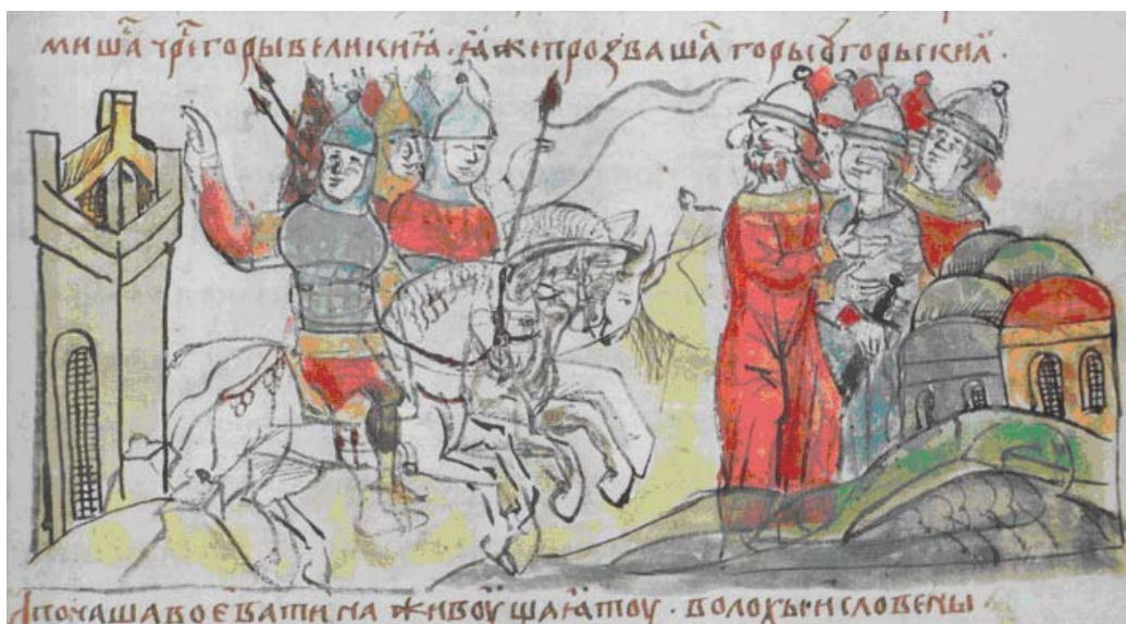
Рис. 4. Миниатюра из Радзивилловской летописи (Л. 12).