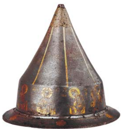
Рис. 1. Шлем с Деисусом (Музеи Московского Кремля, № ОР – 4732).