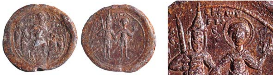
Рис. 8. Печать Алексея Комина (SPINK, 1998. № 93).