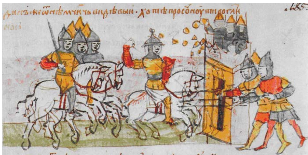
Рис. 3. Миниатюра из Радзивилловской летописи (Л. 185).