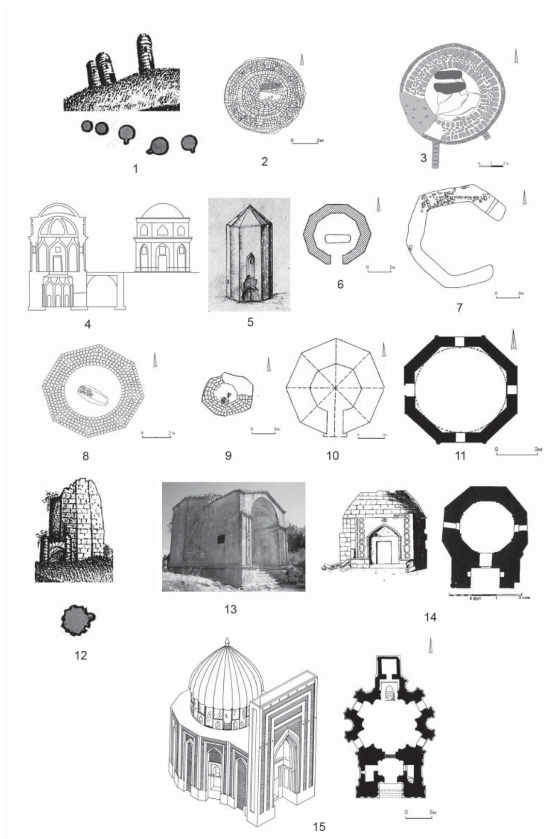
Рис. 1. Башенные мавзолеи Золотой Орды, круглые в плане (1–3), многогранные (4–15): 1 – Маджар; 2 – Шарахалсун; 3 – Жайык; 4 – Маслов Кут; 5 – Кавказ (карта Штедера); 6 – Подкумок; 7 – Царевское городище; 8 – Солодовка; 9 – х. Веселый; 10 – Изобильное; 11 – Асиз; 12 – Маджар; 13 – Чуфут-кале; 14 – р. Мечетная; 15 – Тюрабек-ханым в Куня Ургенче.