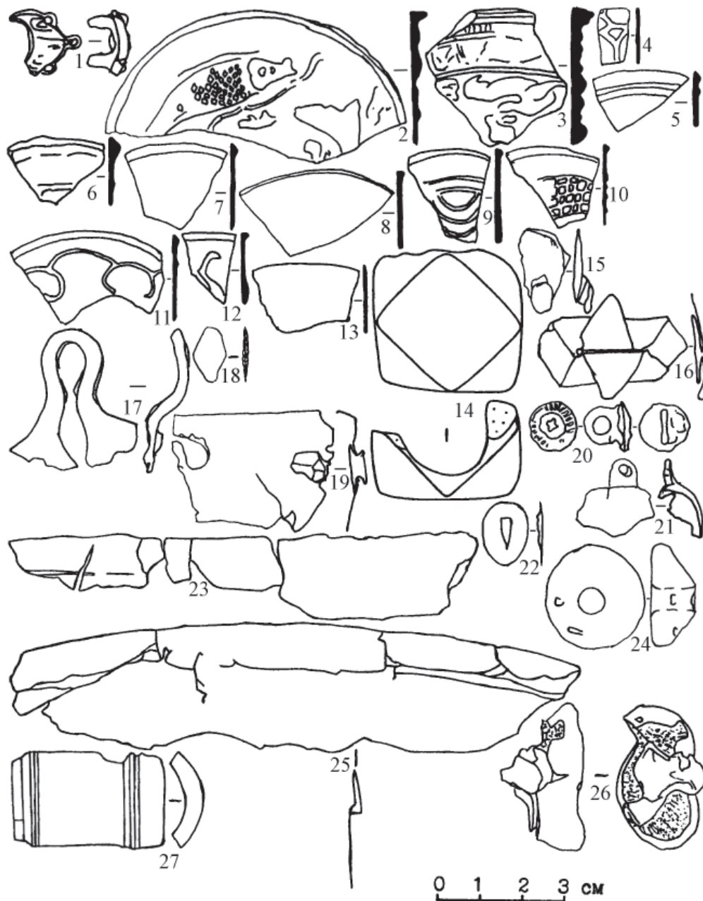
Рис.1. Накладка (1), фрагменты зеркал (2–13), булавы (14), заклепки (15–16), ушко (17), обломок листа (18), фрагменты кованых сосудов (19,23,25), пуговица (20), бубенчик (21), муфта (22) и фрагмент рукояти (27) ножа, грузик–пломба (24), бараний астрагал с отверстием, залитым свинцом (26) с селища Широкий Буерак. Саратовский областной музей краеведения. 1–23,25 – бронза; 24 – свинец; 26 – кость и свинец; 27 – кость. 1–17,19–22,24,26 – подъемный материал Л.Ф. Недашковского 2002 (1–13,15–17,19–22,24,26) и 1996 (14) гг. 18,27 – раскоп I–2002: 18 – культурный слой (№ 7, –62 см); 27 – яма 1 (№ 10, –127 см).