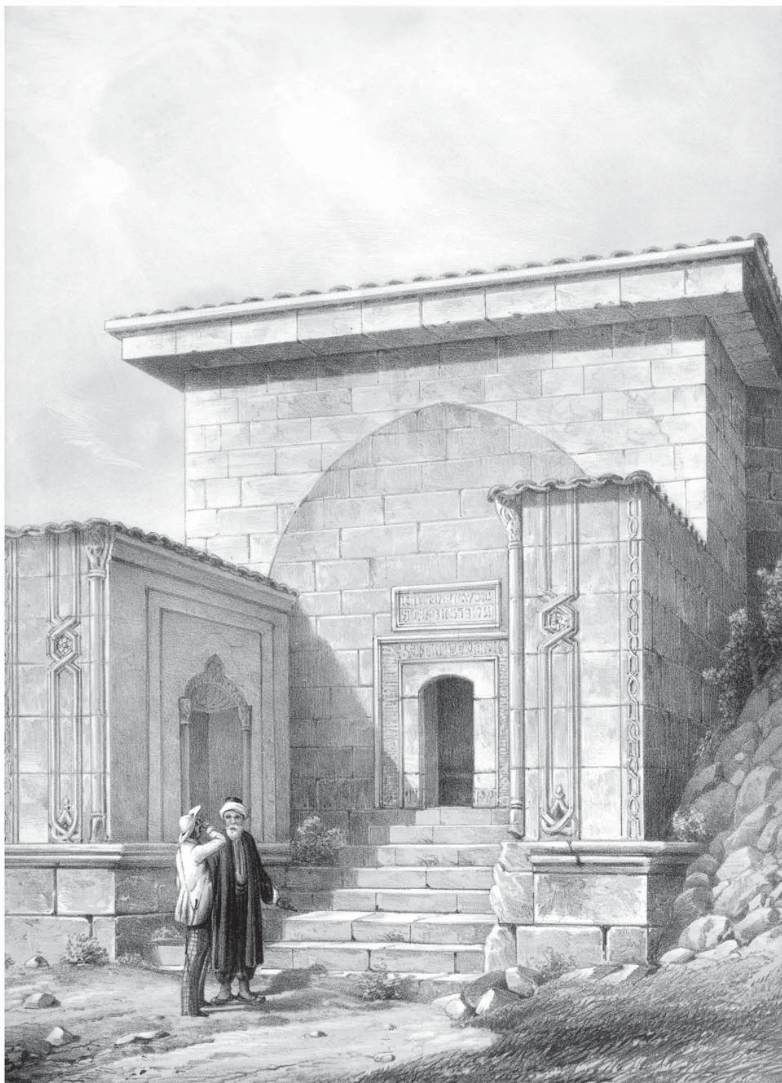
Рис. 2. Чуфут-кале. Мавзолей Джанике-ханым. Из неизданного альбома А.С. Уварова. 1848.